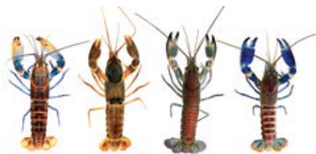
„Raci rodu Cherax , vyskytující se na Nové Guineji.“