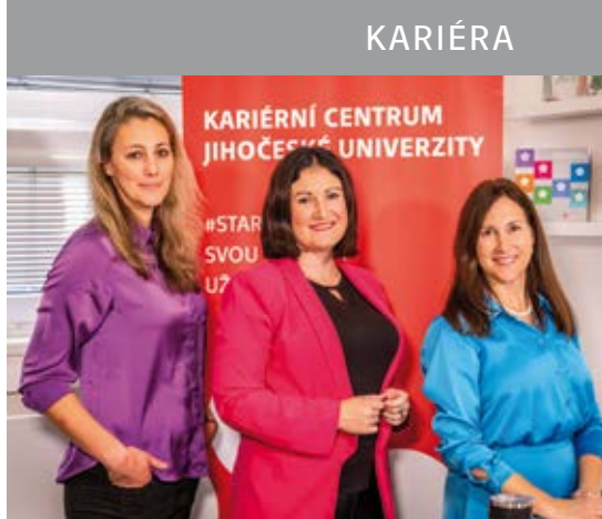
Tým Kariérního centra JU