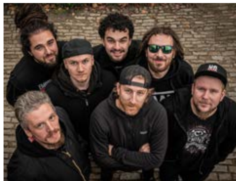
Kapela Helenine oči je headlinerem letošního ročníku

Zajímavé interpretace nabízí i aktuální ročník. Na louce za kolejemi u Studentského klubu Kampa vyroste v úterý 14. května pódium, na kterém se postupně představí kapela